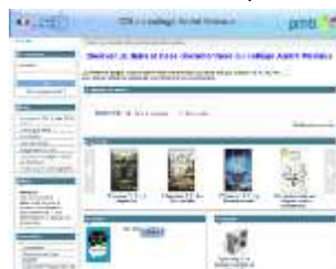
Site Internet du CDI