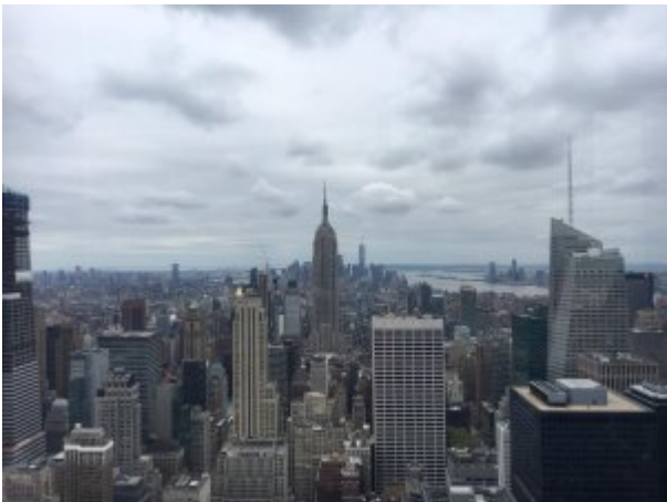
Nous avons la pause déjeuner au pied du Rockefeller center