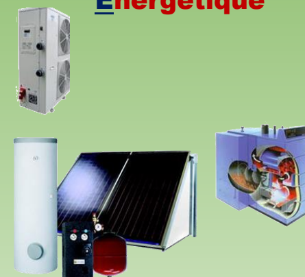
BAC PRO MEE