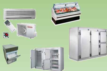
BAC PRO MFER