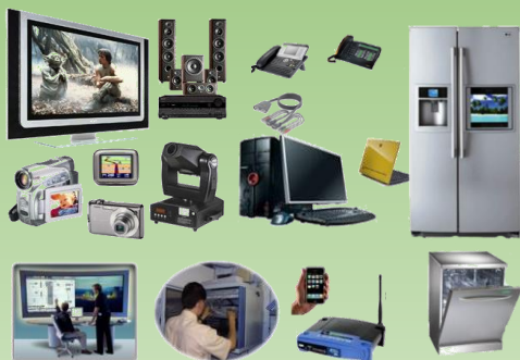
BAC PRO CIEL