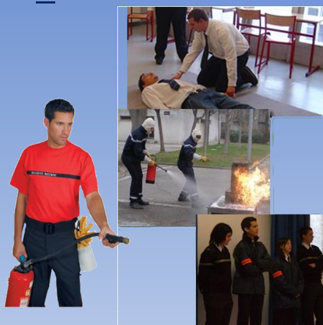
Le CAP AS