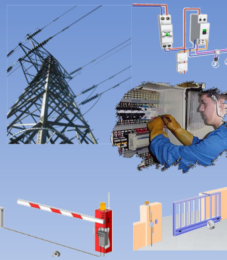
Le CAP ELEC