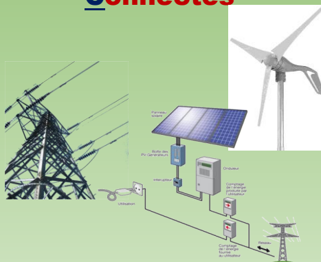
BAC PRO MELEC