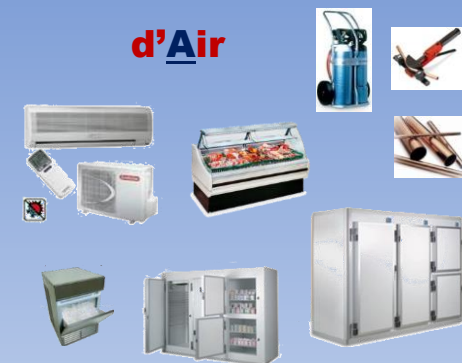
Le CAP IFCA